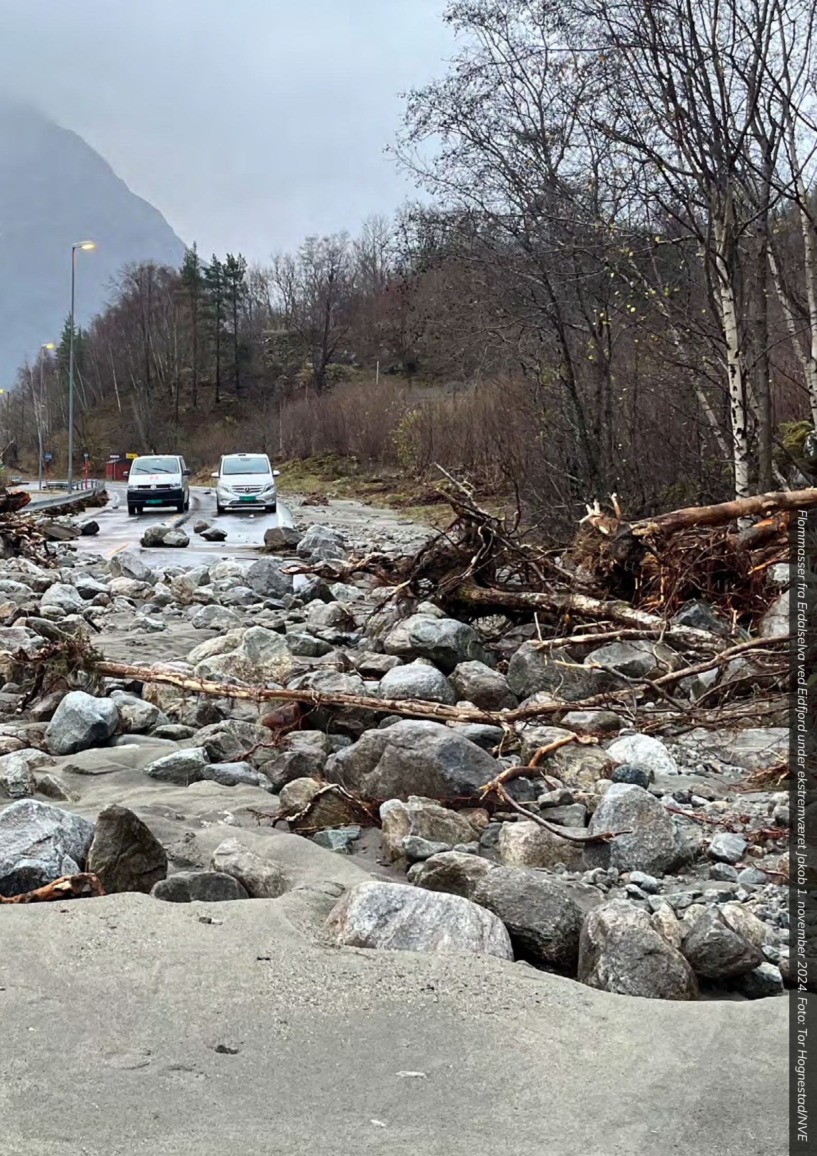
Flommasser fra Erdalselva ved Eidfjord under ekstremværet Jakob 1. november 2024.