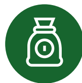
Selskaps- og eierskapsregister