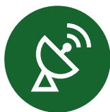
Jordobservasjons- og miljødata