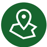
Kart og kartdata

For å styrke både innovasjon og samfunnsikkerhet bør regelverket for kartdata moderniseres, samordnes og oppdateres, slik at det gir tydelige rammer for både offentlig og privat sektor.