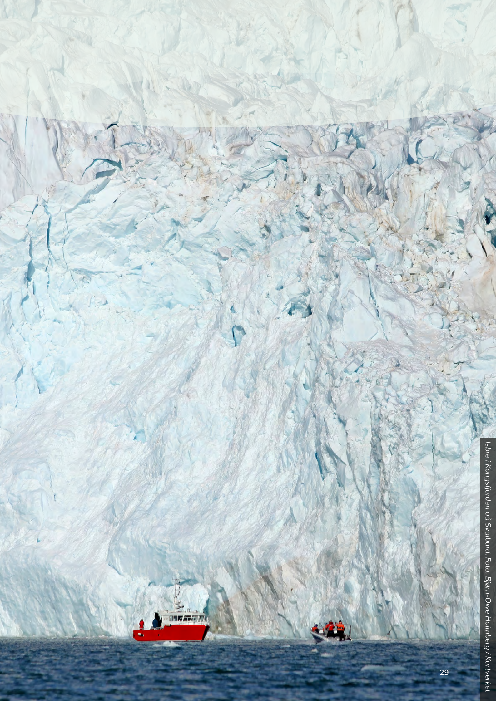
Isbre i Kongsfjorden på Svalbard.