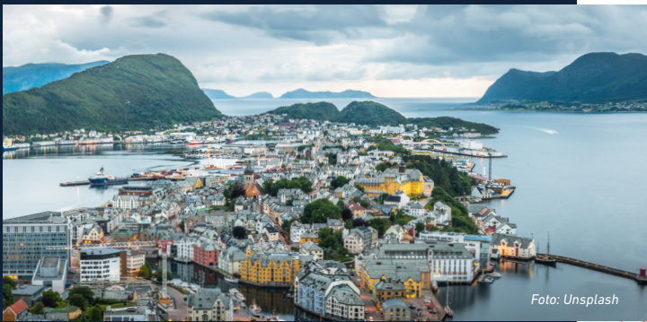
Ålesund og Giske, Møre og Romsdal