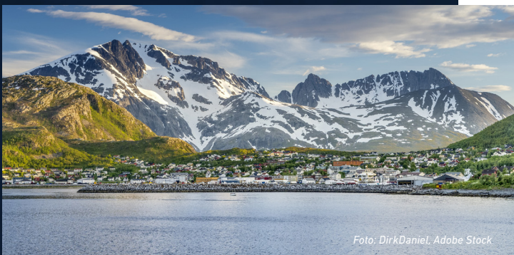
Skjervøy og Kvænangen, Troms og Finnmark